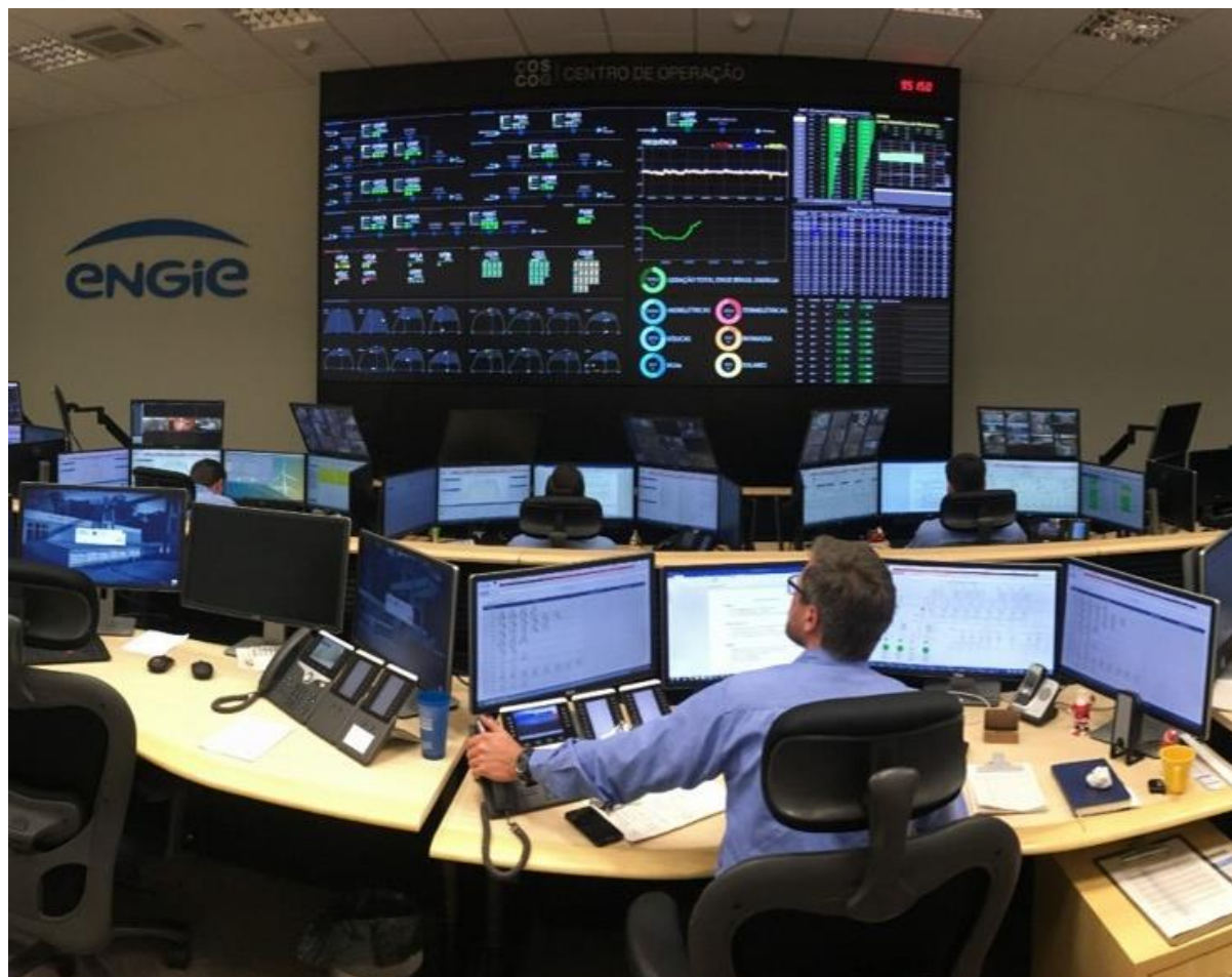
-Imagem do Centro de Operação da ENGIE -